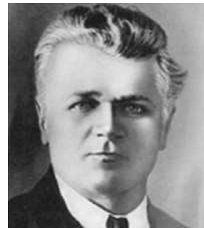
Станислав Теофилович Шацкий (1878–1934) – Выдающийся русский советский педагог.